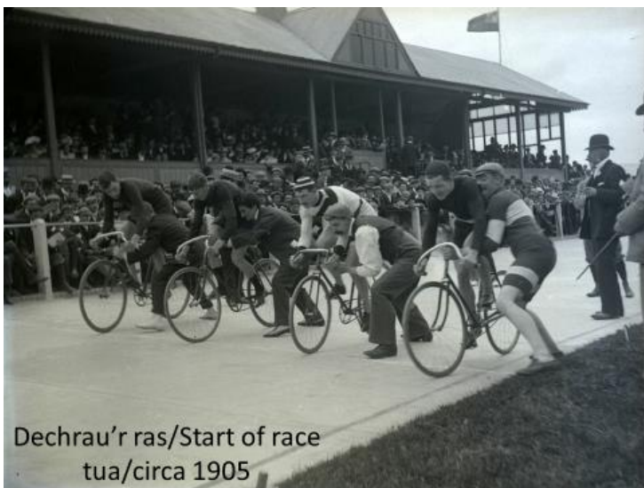
Dechrau'r ras/Start of race tua/circa 1905